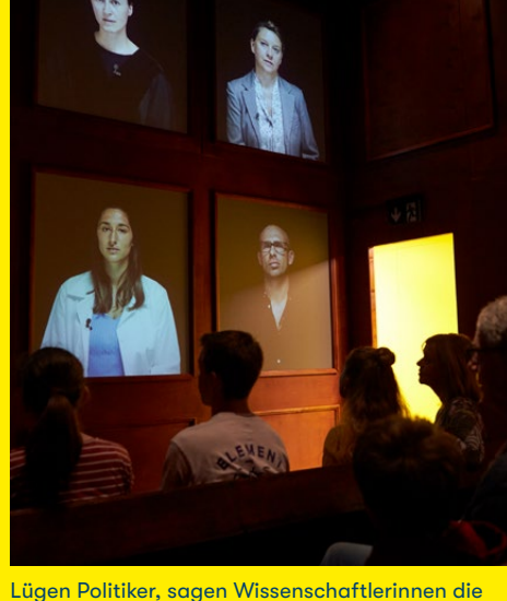
Lügen Politiker, sagen Wissenschaftlerinnen die ganze Wahrheit und wie gehen Journalisten mit Fakten um? In der Kommission für Glaubwürdigkeit stellen sich Verantwortungsträgerinnen und -träger der Vertrauensfrage.