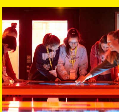
Nachrichten im Faktencheck: Die Dienststelle für Wahrheitsfindung und -sicherung zeigt, wie Falschmeldungen erkannt werden.