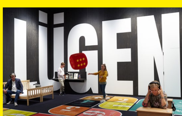
«Du sollst nicht lügen» – das haben wir alle gelernt. Die Fachabteilung für Lügnerziehung und Pinocchioforschung zeigt die Hintergründe aus Schule, Religion und Kultur dazu.