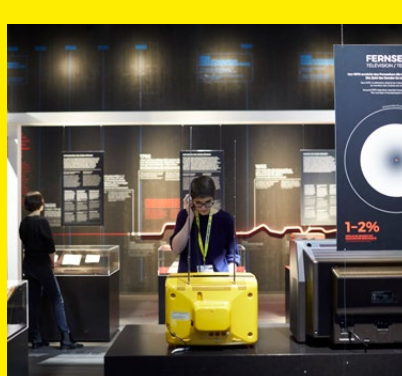
Fake News sind nicht neu. Was aber seit dem Aufkommen von Internet und Social Media anders ist, thematisiert die Medienstelle für alte und neue Fake News.