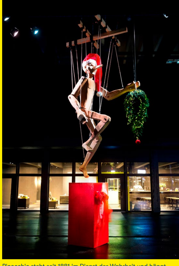
Pinocchio steht seit 1881 im Dienst der Wahrheit und hängt zur Begrüssung in der Stapferhaus-Pergola. Manchmal auch in festlichem Gewand.

Noch mehr als über die guten Zahlen freuen wir uns über das, was der Besuch unseres Amtes auslöst: intensive Diskussionen darüber, ob es die Wahrheit überhaupt gibt und wie man ihr auf die Spur kommt, ob Lügen in jedem Fall schlecht sind und wie wichtig Glaubwürdigkeit und Vertrauen für ein gelingendes Zusammenleben sind. Die Besucherinnen und Besucher haben unserem Amt bereits über 2000 persönliche Lügengeschichten hinterlassen – sie liegen zu Sammelbänden gebunden im Bistro auf. Auf ihrem Rundgang haben sie zudem über 60 Lügen bewertet und damit eine spannende Statistik geschaffen: Während ein Grossteil «Systemlügen» (Postauto-Skandal, Affäre Maudet u. a.) eindeutig als verwerflich beurteilt, scheiden sich bei den «persönlichen Lügen» die Geister – je nach Alter, Geschlecht oder politischer Zugehörigkeit.