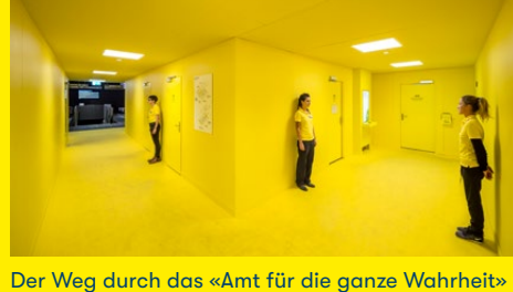
Der Weg durch das «Amt für die ganze Wahrheit» sorgt zuweilen für Verwirrung – führt aber immer zu acht informativ-unterhaltsamen Abteilungen.