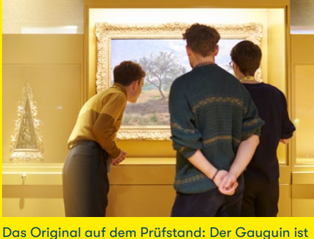
Das Original auf dem Prüfstand: Der Gauguin ist echt, die Blancpain auch. Die Gucci-Tasche aber ist Fake. Was den Unterschied macht und warum das Original so viel Wert hat – darum geht's in der Prüfstation für Fälschungen und ihr Gegenteil.