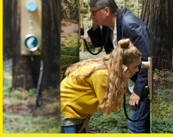
«Der Mensch ist das einzige Tier, das lügen kann», sagt der Chefbeamte. In der Abteilung für strategische Täuschung kommen die Tiere selbst zu Wort.