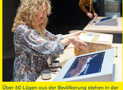
Über 60 Lügen aus der Bevölkerung stehen in der Zentralen Lügenanlaufstelle in Päckli verpackt zur Bewertung bereit: «ausnahmsweise», «nötig» oder «geht gar nicht»?